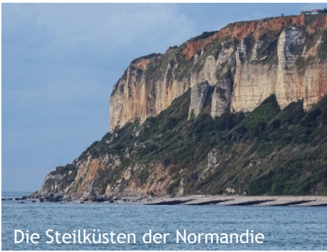
Die Steilküsten der Normandie