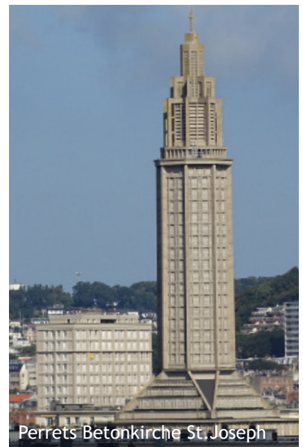
Perrets Betonkirche St. Joseph