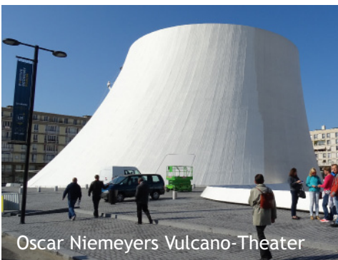
Oscar Niemeyers Vulcano-Theater