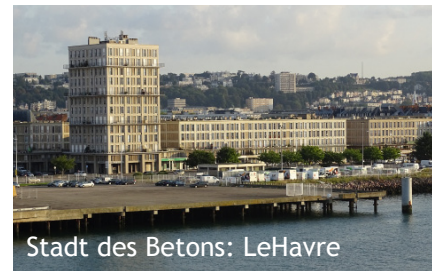
Stadt des Betons: LeHavre

LeHavre hat nur etwa 175'000 Einwohner, ist also ziemlich überschaubar. Sein berühmtester Bürger dürfte Claude Monet sein, der hier aufgewachsen ist und im nahegelegenen Hafenstädtchen Honfleur (auf der gegenüberliegenden Seite der Seine) zusammen mit den Malerkollegen seiner Zeit den Impressionismus «erfand». Und das ging so: Monet hatte 1874 einen schönen Sonnenaufgang gemalt. Er wollte dieses Bild ausstellen und hatte dafür keinen Titel. Den brauchte man aber, um ein Bild ausstellen zu können. Er nannte es einfach « Impression. Sonnenaufgang ». Das war der Start zum Impressionismus. Noch berühmter als sein Sonnenaufgang ist sein Bildzyklus mit den Seerosen, die er in Giverny (auch hier in der Nähe) gemalt hat. Und sein Zyklus der Kathedrale von Rouen, von der er zwischen 1892-94 nicht weniger als 35 Versionen gepinselt hat. Hat unsere Reiseleiterin erzählt.