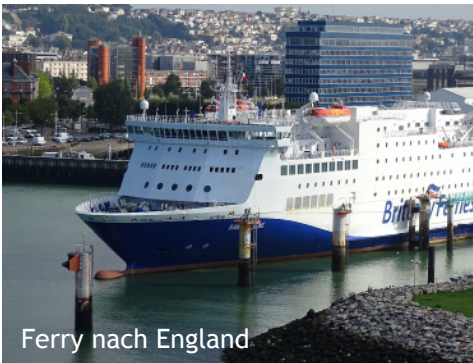
Ferry nach England