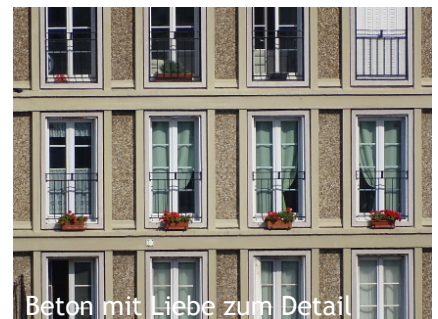
Beton mit Liebe zum Detail